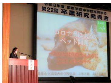
(全日制課程発表会)

本校の特色ある取り組みの1つに、「主体的に学んで発表する」探究学習が挙げられます。そのハイライトとなるのが高校3年の卒業間際に行う卒業研究発表会です。生徒たちは2年次から取り組み、研究テーマはSDGsの目標いずれかに絡めています。高校生活の集大成として、多くの人を前に自信を持ってプレゼンテーションを行いました。